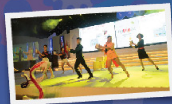
การแสดงของชาวเบสท์เวิลด์