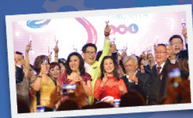
งานฉลองประจำปีบิตดับเบิลยูแอล