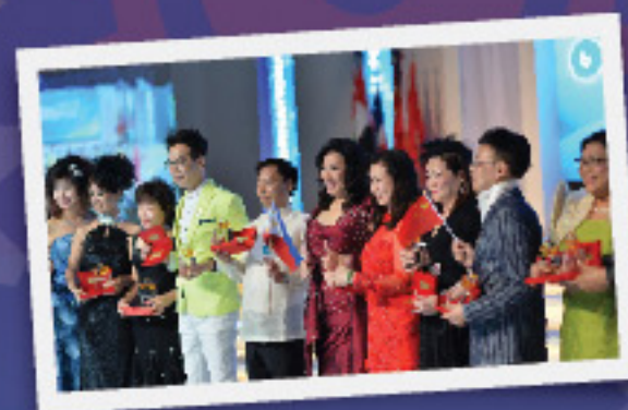
พิธีมอบรางวัล