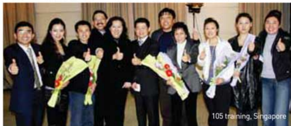
105 training, Singapore