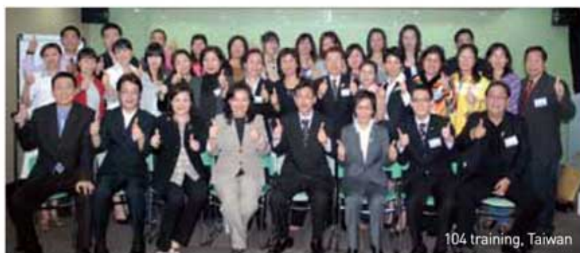
104 training, Taiwan