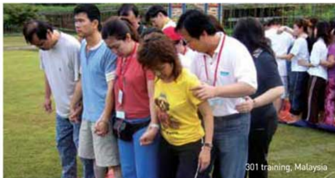
301 training, Malaysia