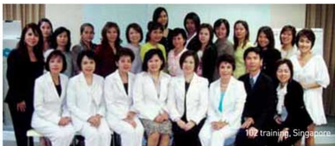
102 training, Singapore