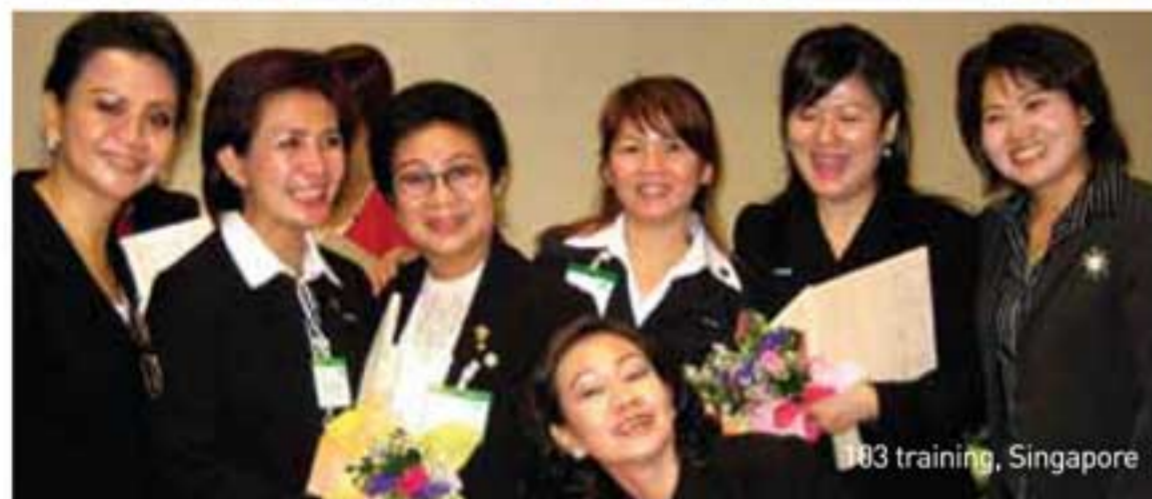
103 training, Singapore